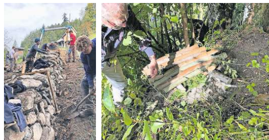
Zivildienstleistende arbeiten an der Trockensteinmauer (oben und unten links). Bau eines Nistkastens für Mauswiesel und Hermeline am Frondienstag der Bewohner der Gesellschaft Gütsch (unten rechts).